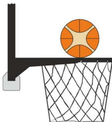
Diagrama 3 Bola está em contato com o aro

31.18 DETERMINAÇÃO: É uma violação de interferência se um jogador defensivo ou ofensivo, durante um arremesso para uma cesta de campo, toca a cesta ou a tabela enquanto a bola está em contato com o aro e ainda tem uma possibilidade de entrar na cesta.