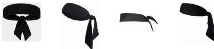
Diagrama 1 Exemplos de bandana tipo lenço

4.4 DETERMINAÇÃO: O uso de bandanas tipo lenço não é permitido