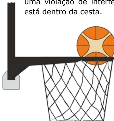
Diagrama 4 Bola está dentro da cesta

31.24 EXEMPLO: A1 tenta um arremesso para uma cesta de campo de 2 pontos. Enquanto a bola está em contato com o aro e uma pequena parte está dentro ou abaixo do nível do aro, quando