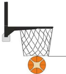
Diagrama 2 Uma cesta é convertida

16.14 EXEMPLO: Restando 2.02 no cronômetro de jogo no quarto quarto, A1 converte uma cesta de campo quando a bola passa através da cesta. Restando 2.00 no cronômetro de jogo B1 está pronto para a reposição na linha final.